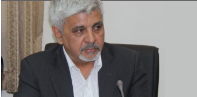
نایب رئیس اتاق اصناف شیراز: