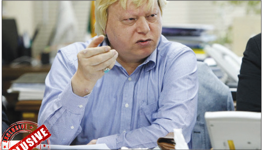
سید محمد بهشتی شیرازی: